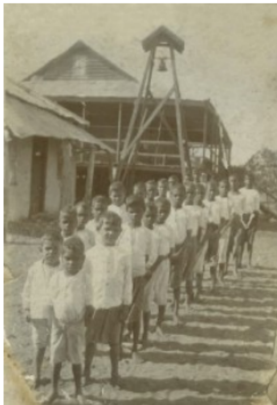
Niños en las escuelas lejos de sus familias