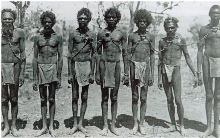
Grupo de aborígenes encadenados utilizados como esclavos